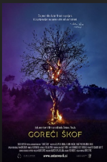
Goreči škof film o škofu Antonu Vovku www.siposh.com/goreciskof

Oglejte si naše prejšnje filme, ki razkrivajo pomembne dele slovenske zgodovine: