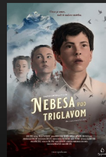
Nebesa pod Triglavom film o usodni noči leta 1942 www.siposh.com/nebesa