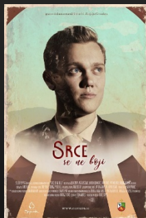
Srce se ne boji film o bl. Alojziju Grozdetu www.siposh.com/srceseneboji