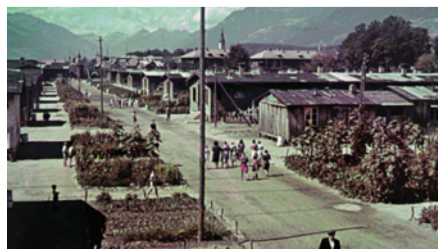
Taborišče v Spittalu.