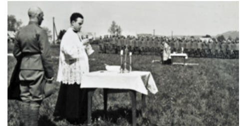
Maša za begunce na Vetrinjskem polju.

Prihodnje dni so bili poslani v »Italijo« transporti s slovenskimi domobranci in nekaj sto civilistov, po večini sorodnikov. Prvi transport je odšel v nedeljo 27. maja 1945, naslednji pa 28. maja, 29. maja, 30. maja in 31. maja. Po