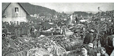
Vetrinjsko polje pri Celovcu - domobranci begunsko taborišče 1945.

Ljubeljski tunel: blato čez gležnje, polno odvrženih nemških ročnih granat, konji in vozovi in mule in ljudje in tema in gneča. Vsem se mudi, vsi hitimo na drugo stran, tunel se zagolsne. Mislim, ki se vsiljujejo, ne dovolim do besede. Pred tunelom goreča skladišča, eksplozije, mali kozaški konjički kot gamsi na vzpetinah, v cestnih jarkih prevrnjeni avtomobili, tovornjaki in vozovi. In ljudje, ljudje vseh vrst, Srbi in Rusi in Nemci in seveda Slovenci, vojaki in civilisti, otroci in odrasli. Kako uro po našem odhodu iz Tržiča so na bežeče začeli streljati z minometalci - občutek zbegane nemoči, ko so nas dotekli s svojo novico. Na drugi strani Ljubelja spet cesta, ki se zdi neskončna. Ob njej poginuli konji in mule, ki nabrekajo in se razpočijo v strašen smrad. Na