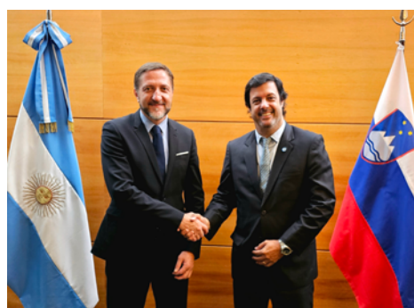
Minister in Dario Genua, sekretar za digitalizacijo

Slovenija je na določenih področjih informacijske tehnologije zelo napredovala, predvsem na razvoju umetne inteligence. Gre za novo, zelo hitro razvijajoče se področje. V Sloveniji je relativno močna skupnost startup podjetij, ki delujejo na IT in umetni inteligenci in to je gotovo eno od treh najbolj pomembnih strateških gospodarskih področij, v kate-