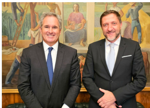
Minister in Pablo Quirno, sekretar za finance

Tudi glede sodelovanja med obema državama vidim velike možnosti na področju, ki sva