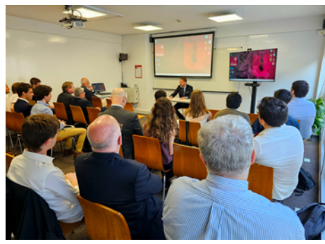
Predavanje na UCEMA

→ V bistvu za celoten zahoden svet velja, da izrazito rastejo stroški staranja, to so na eni strani stroški pokojnin, na drugi stra-