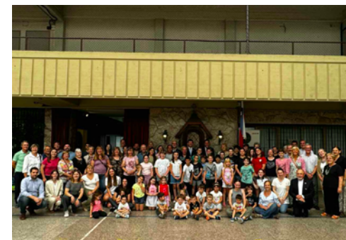
Srečanje v Našem domu San Justo

In dal bi vam tudi en nasvet: danes sem obiskal eno slovensko šolo in sem videl, kaj vse delate in dajete. In glede na to gotovo zaslu-