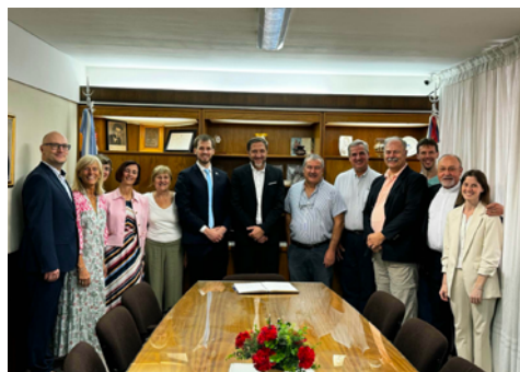
Srečanje z odborniki Našega doma San Justo

ga že omenila: informacijske tehnologije in predvsem umetne inteligence. Argentinska stran je izrazila, da se želijo z nami povezovati in delati na zelo konkretnih projektih in to je verjetno tisto področje, kjer sta obe državi zelo ambiciozni. Tudi Slovenija želi obdržati in še okrepiti ta položaj, ki ga imamo na področju umetne inteligence, zato je gotovo prvo, na katerem moramo začeti delati.