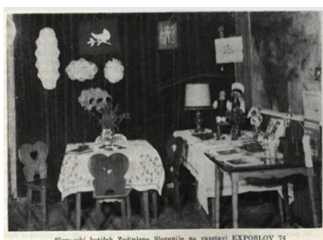
Slovenski kotiček Zedinjene Slovenije na razstavi EXPOSLOV 74