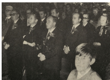
Med Blagoslovitvijo. Pogled na del občinstva. V prvih vrstah botri.